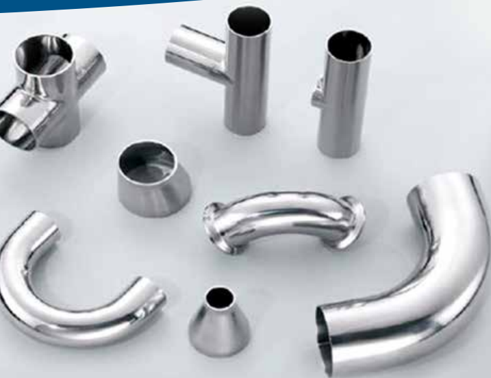
Soldables y clamp